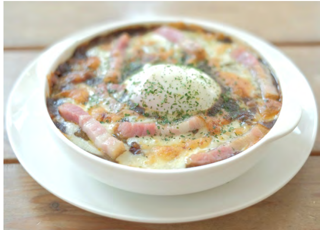
温玉カレードリア 1100円