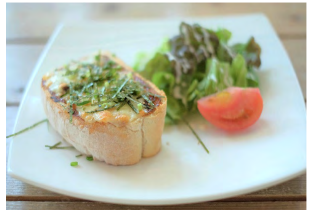
和風味噌トースト 750円