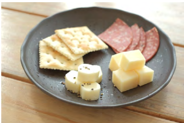
チーズとサラミの 盛り合わせ 500円